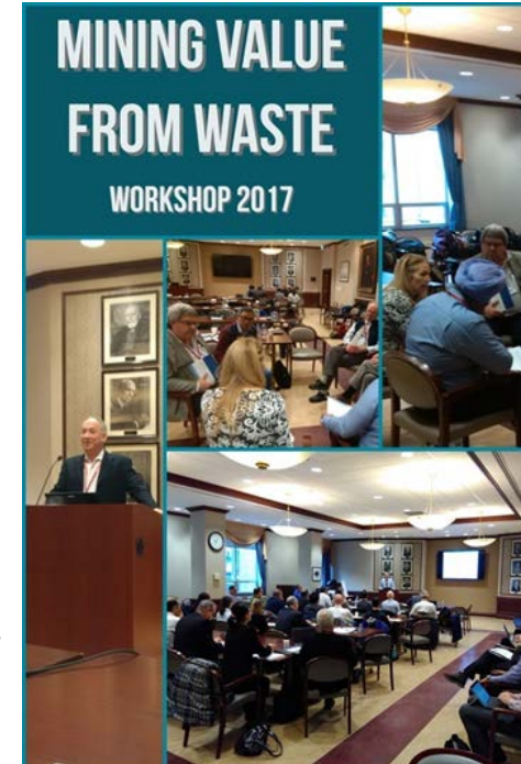
Traduction: Valorisation des résidus miniers, atelier 2017